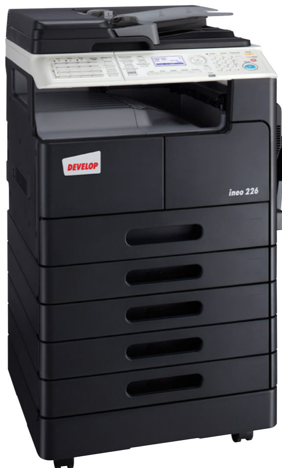
ineo 226, eredeti duplex lapadagoló (DF-625), fax funkció, duplex egység (AD-509), kiegészítő papírtálcák (PF-507), és gépasztal (DK-708)

Az ineo 226 első osztályú nyomtatás minőségét az ultrafinom részecskéjű HD toner garantálja. A különbség szemmel látható a szimpla szürkeárnyalatos gradáció között pl. a jól olvasható és éles, kristálytisztá betűk láttán.